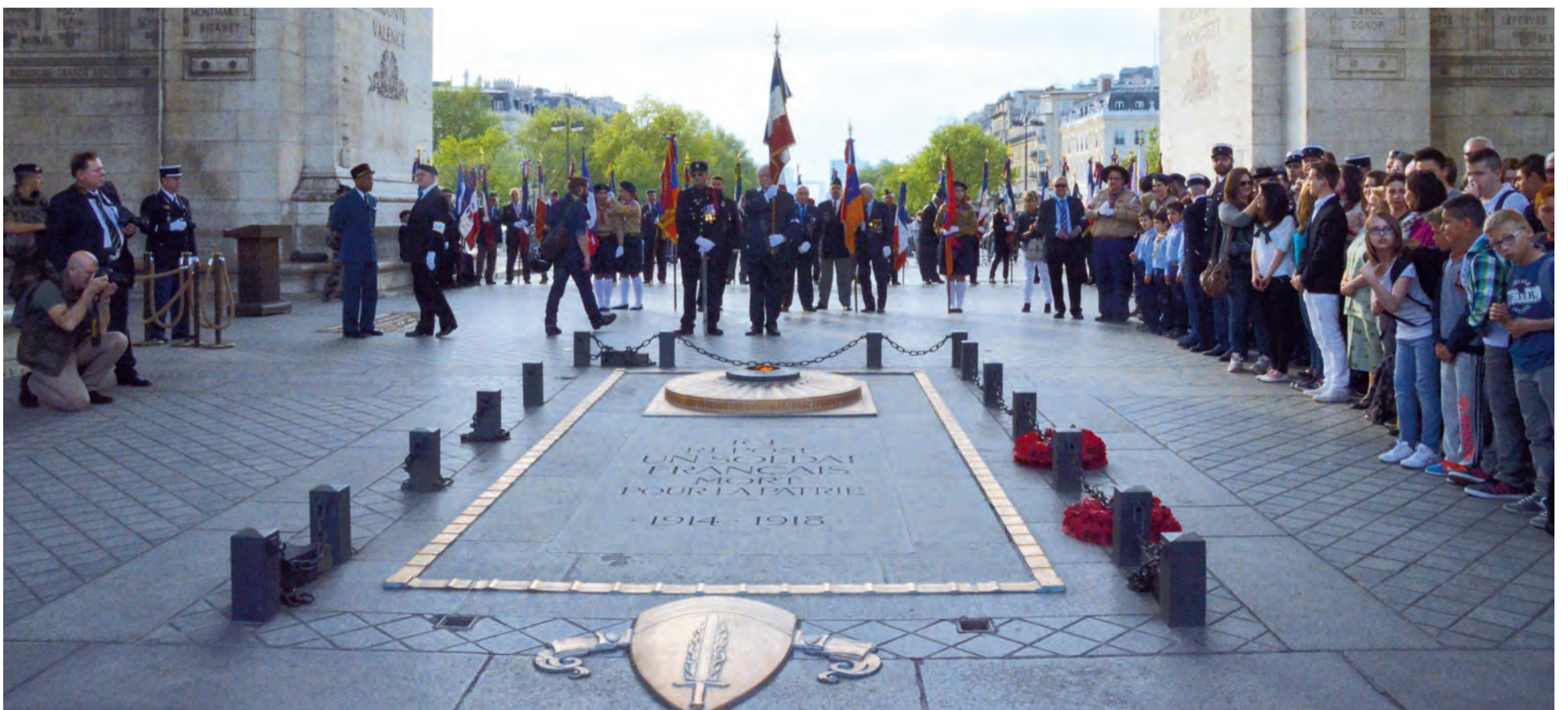
La tombe du Soldat inconnu et la Flamme sous l'Arc de Triomphe de Paris avant l'arrivée des participants.