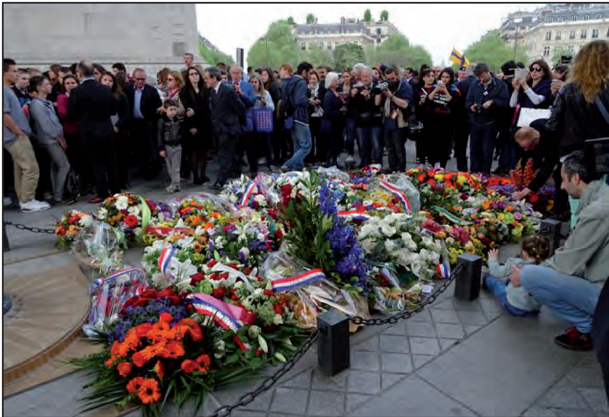
Fin de la cérémonie. Vue générale du parterre des 34 gerbes de fleurs et de la foule des participants.